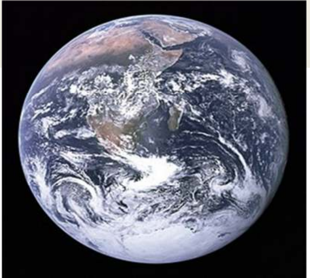
Ο πλανήτης Γη όπως αποτυπώθηκε από το πλήρωμα της διαστημικής αποστολής «Απόλλων 17».